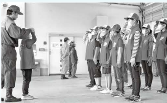
基本の姿勢を学びました

令和4年度の入隊式と第1回訓練が消防本部で行われました。隊員総数は47人、そのうち新入隊員は15人です。第1回訓練では、消防隊としての活動で基本となる「敬礼」、「右ならえ」等の規律訓練を行い、その後3・4年生は消防車両の見学、5・6年生は40mmホースを使った放水訓練を行いました。