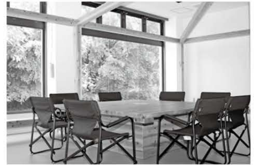
美山ラウンジ イベントスペース等として利用できます