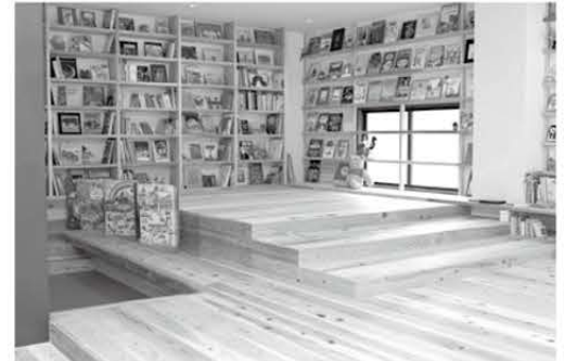
紅梅文庫エリア 子ども向けの本から専門書まで、7千冊を超える多様な蔵書がそろっています