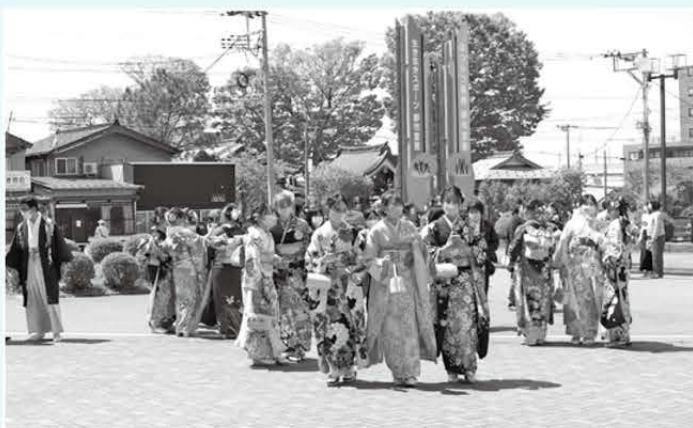
振袖に身を包んだ参加者

参加者は294人。当日は、第1部に式典を行い、第2部は、はたちの集い実行委員会主催のアトラクションが行われました。参加者は、久しぶりの旧友との再会を楽しんでいました。