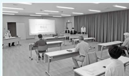
スタート前の開会式