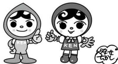
人KENまもるくん 人KENあゆみちゃん 人権イメージキャラクター