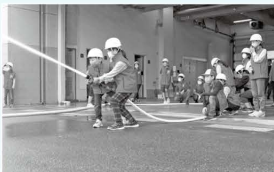
40mmホースを使い放水