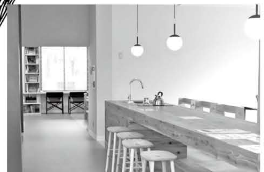
センターキッチン 利用者が自由に使うことができるキッチン